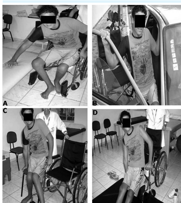
Figura 1: (A) Transferências iniciais da cadeira de rodas para o plinth leito de lado; (B) Transferências iniciais da cadeira de rodas para o carro; (C) Transferências iniciais da cadeira de rodas para a poltrona, e (D) Transferências avançadas da cadeira de rodas para o piso

Na fase de adaptação/hipertrofia, o protocolo de treinamento funcional inicial consistiu de 5 a 8 repetições de exercícios específicos de transferências da cadeira de rodas para o plinth leito de lado (Figura 1A), da cadeira de rodas para o carro (Figura 1B), e da cadeira de rodas para a poltrona (Figura 1C), com intervalo de recuperação de 1 minuto entre cada repetição 2 .